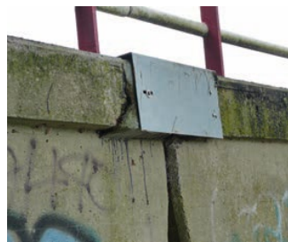
Kristaldruk ettringiet vorming