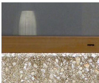
Streepvorming door een te agressief glaswasproduct