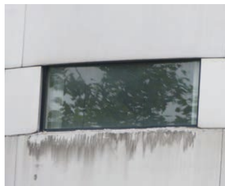
Slecht aangebrachte coating op aluminium

Een gevel bestaat uit diverse materialen met hun specifieke eigenschappen. Reinigers die veilig zijn voor het ene materiaal kunnen andere materialen in dezelfde gevel verwoesten. Sommige schades, zoals onder meer craquelé en scheurvorming door kristaldruk, openbaren zich pas na weken of zelfs jaren. Ook mechanische beschadigingen komen voor. Niet ieder materiaal kan worden gestraald. Natuurstenen en glazen beplatingen zijn erg stootgevoelig. Verschillende gevelmaterialen worden behandeld in de supplementen bij dit kennisdocument.